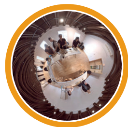
Des cultures vivantes