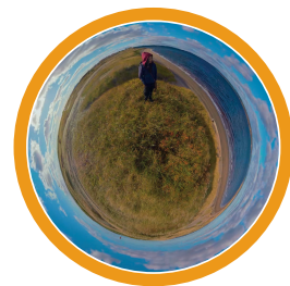
Se déplacer - Se rassembler