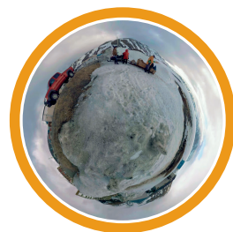
Occuper le territoire